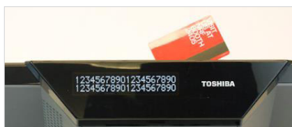
Visor Cliente con Lector de Banda Magnética (MSR)