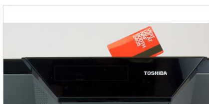
Lector de Banda Magnética (MSR)